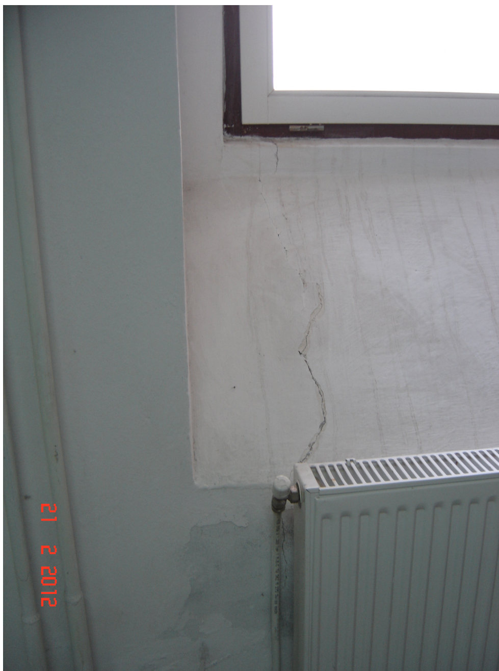
Fig. 39 – Fisuri in zidarie