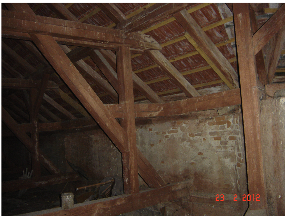
Fig. 42 – Idem