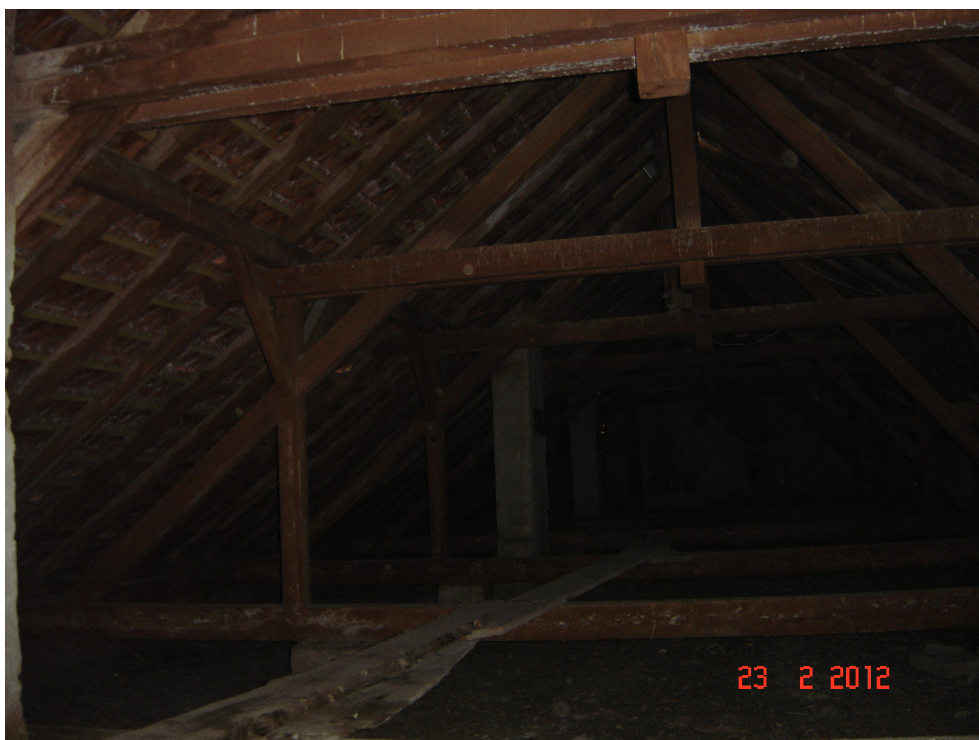
Fig. 40 – Ansamblu sarpanta