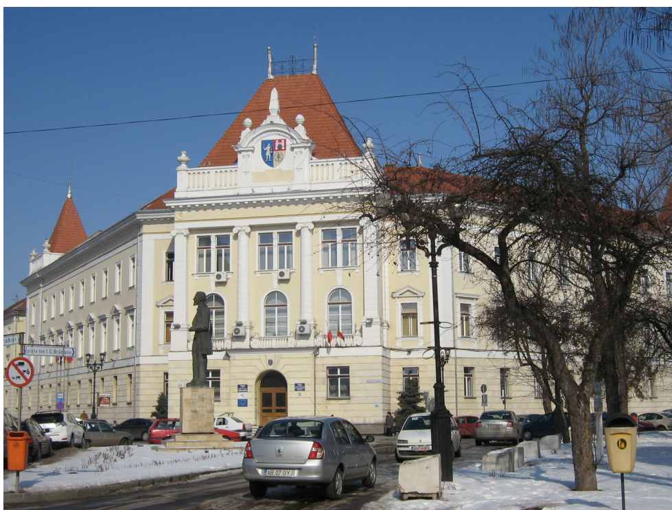
Fig. 1 - Fatada Principala