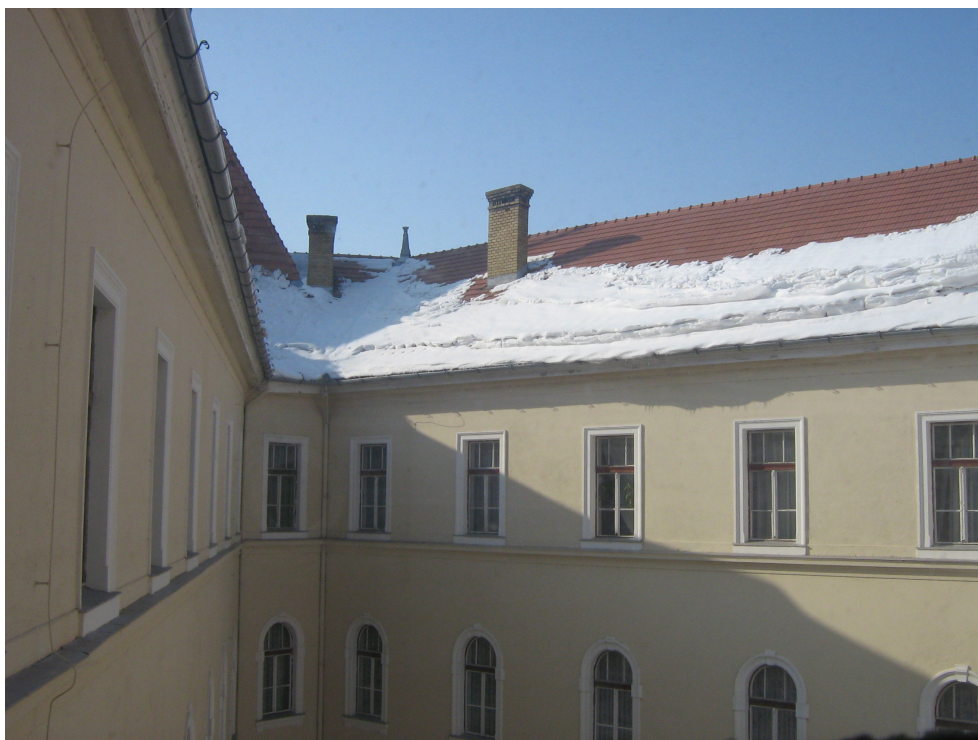
Fig. 14 - Idem