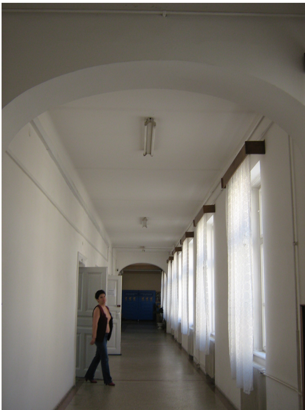
Fig. 21 – Idem