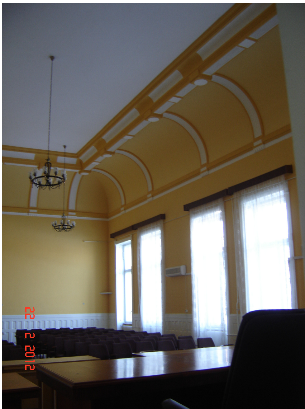
Fig. 28 – Idem