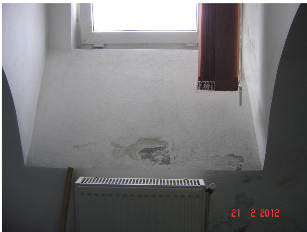
Fig. 38 – Idem