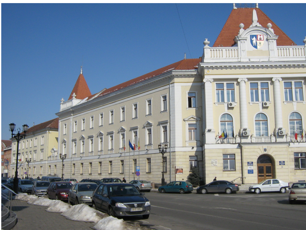
Fig. 3 – Fatada B-dul Ferdinand I