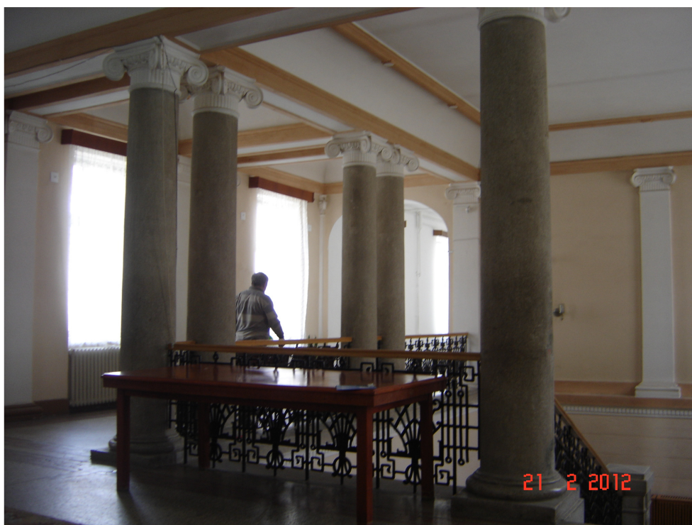
Fig. 18 – Detalii Structura