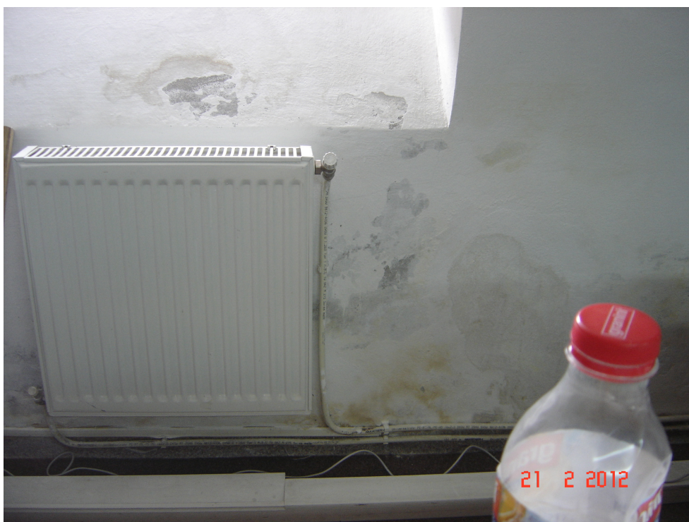
Fig. 36 – Idem