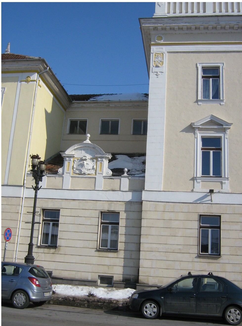
Fig. 9 – Detaliu Fatada B-dul Ferdinand I