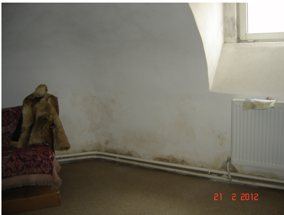
Fig. 37 – Idem