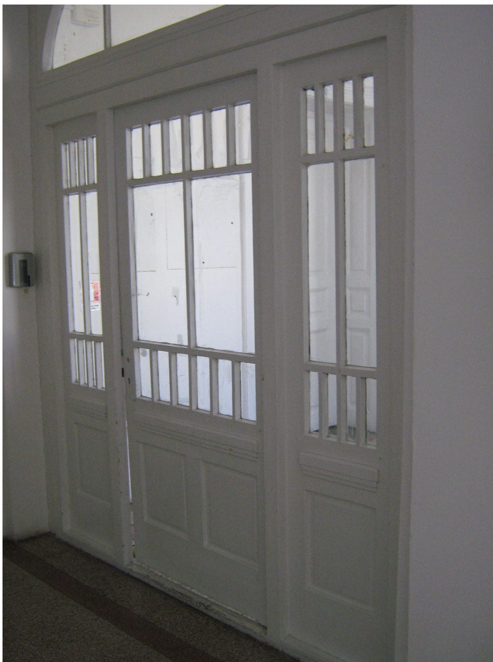
Fig. 24 – Idem