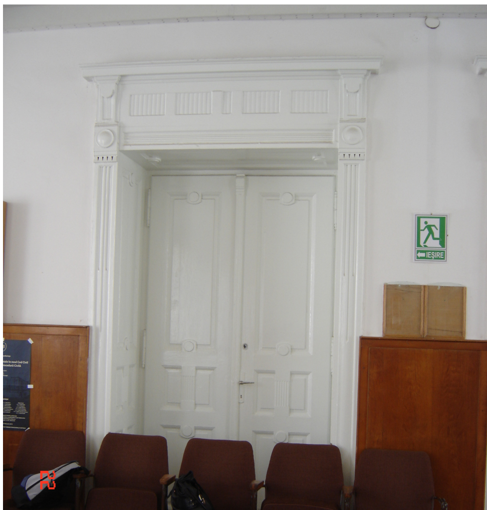
Fig. 25 – Idem