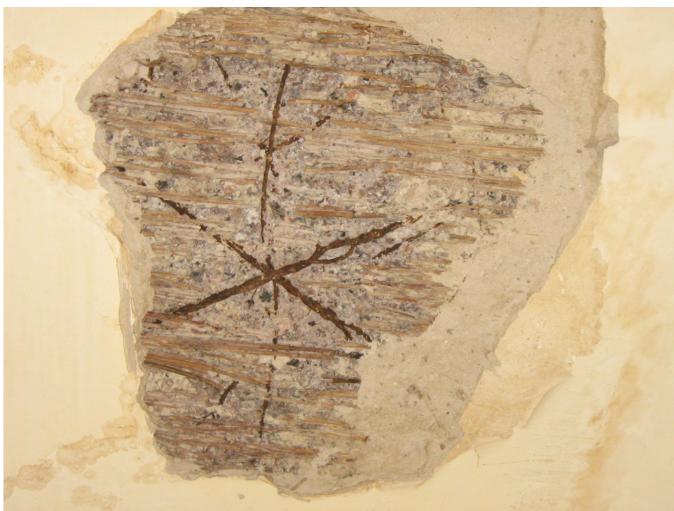
Fig. 32 – Idem