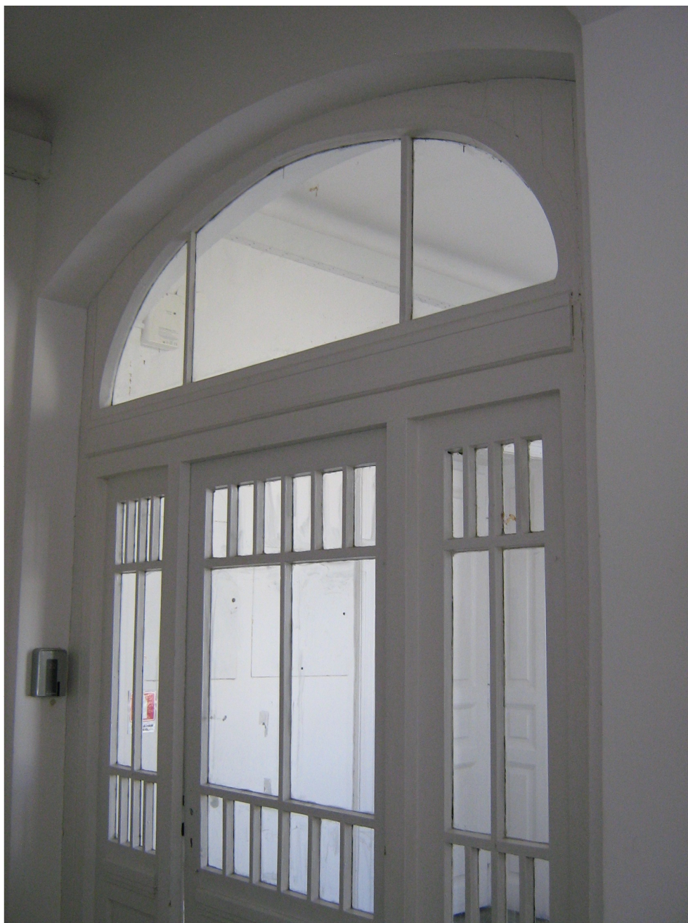
Fig. 23 – Detaliu Tamplarie Interioara