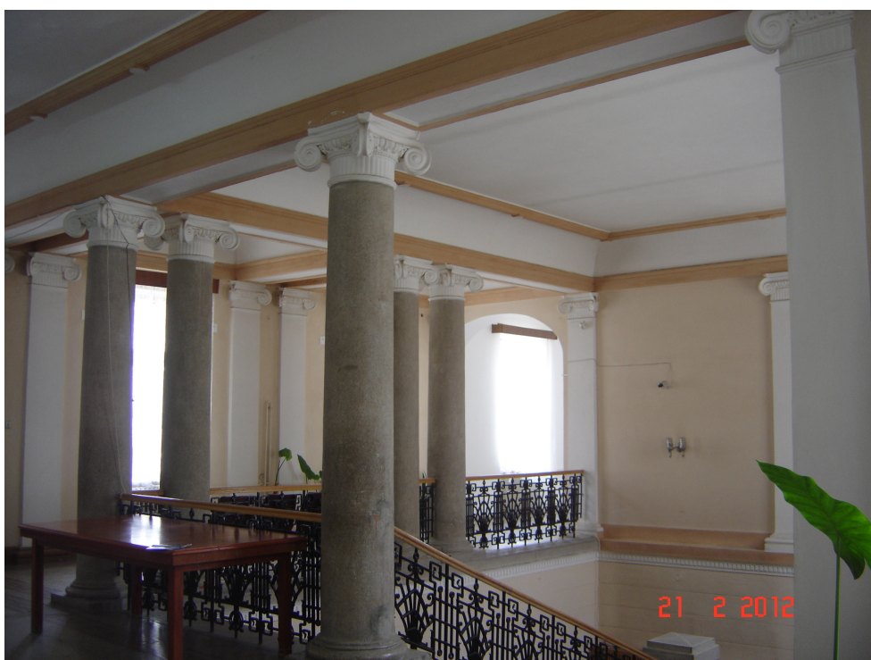
Fig. 19 – Idem