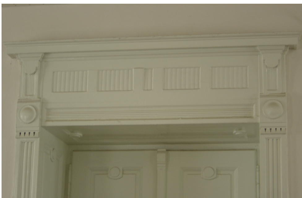
Fig. 26 - Idem