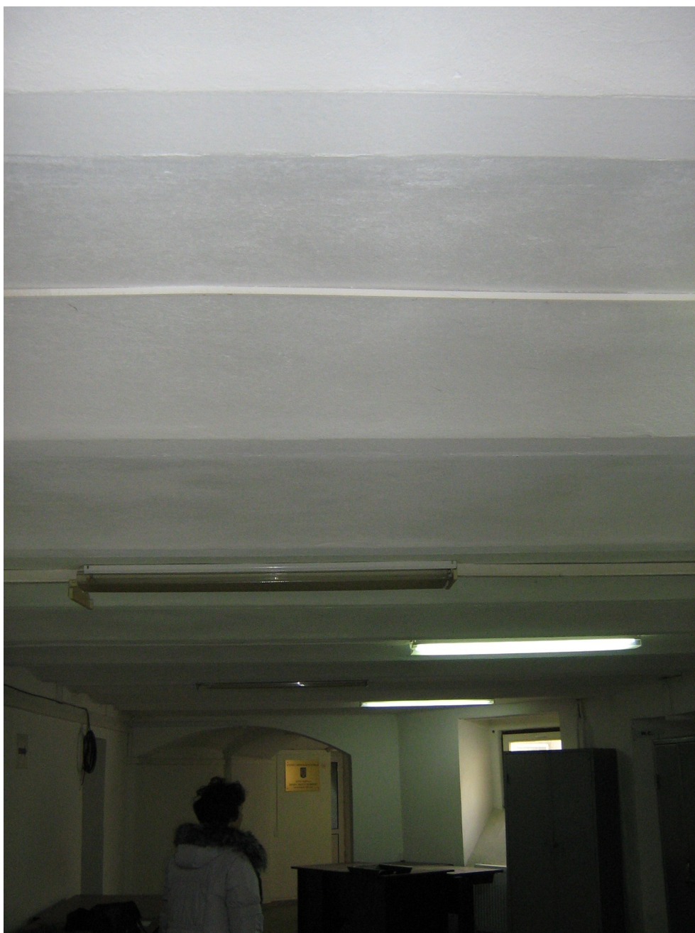
Fig. 29 – Detaliu tavan cu boltisoare