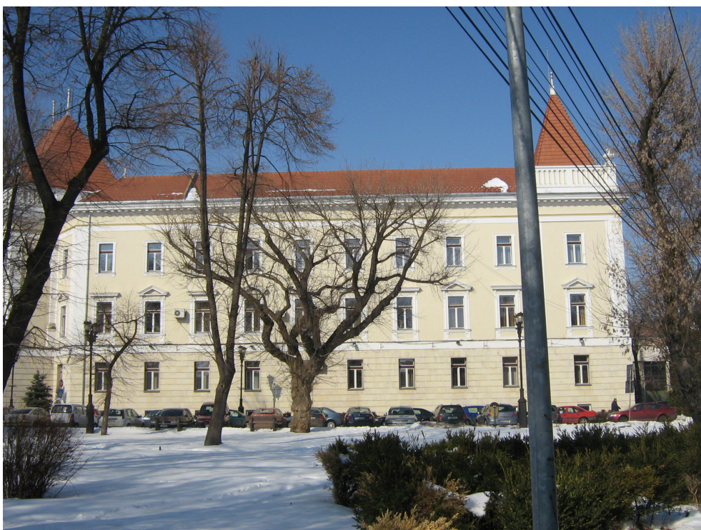
Fig. 5 – Fatada Str. Bucuresti