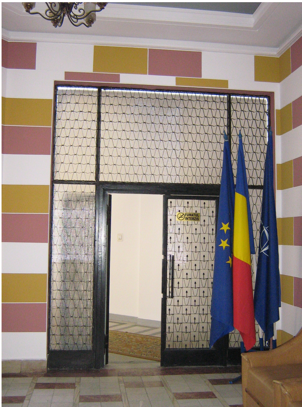
Fig. 22 – Vedere Acces Aripa laterala Stanga