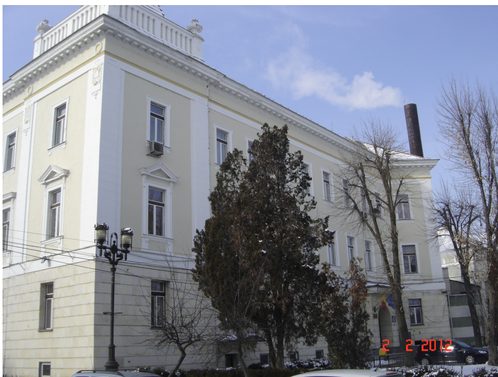
Fig. 6 – Fatada Str. Tribunalului – Acces secundar