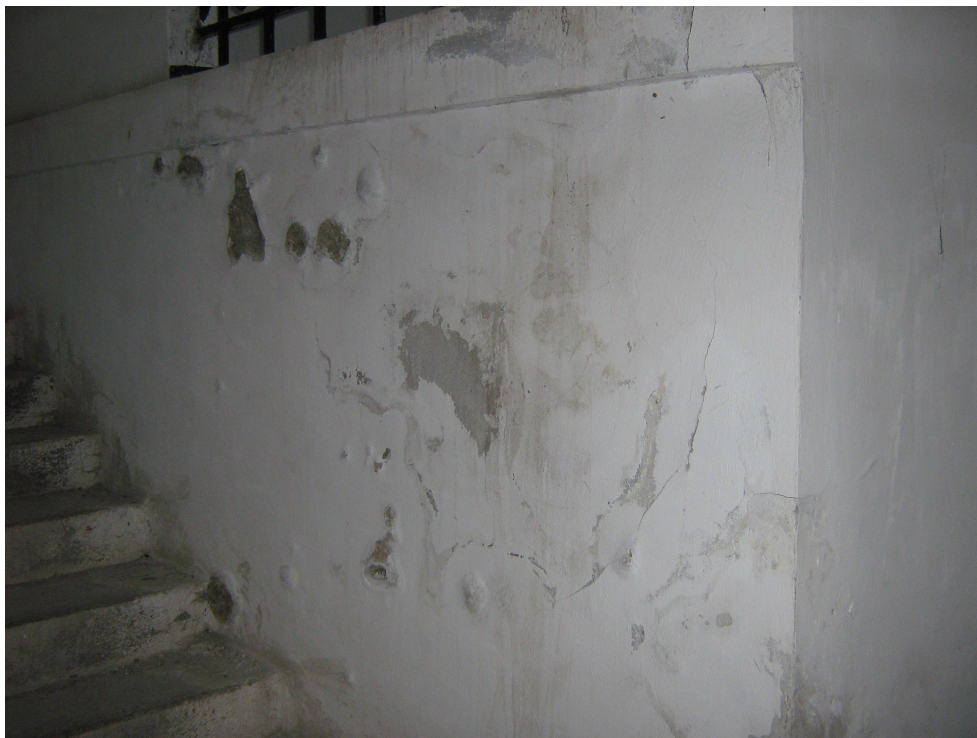
Fig. 35 – Degradari datorate infiltratiilor cu apa