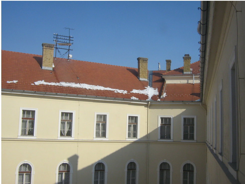
Fig. 16 – Idem