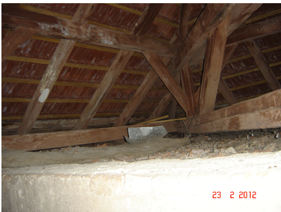
Fig. 43 – Vedere parte inferioara Invelitoare