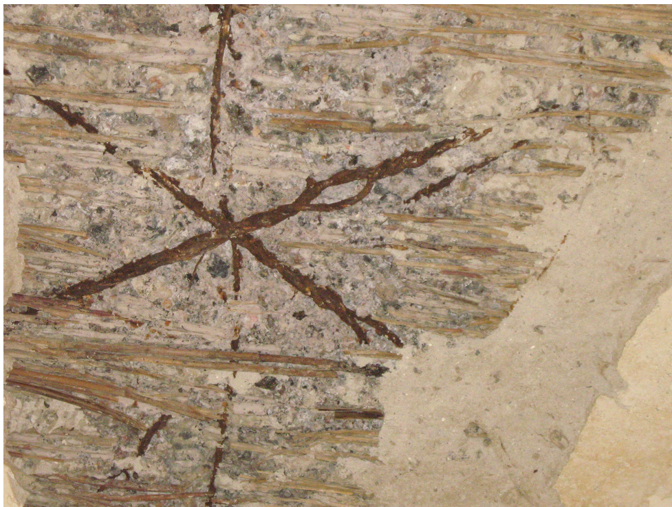
Fig. 31 – Detaliu compozitie tavan