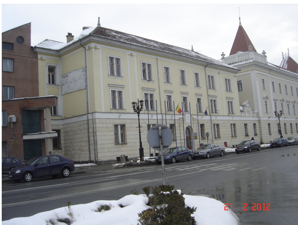
Fig. 4 - Idem