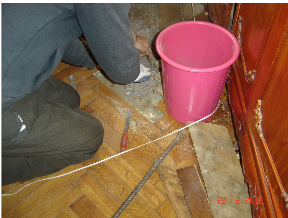
Fig. 34 - Idem