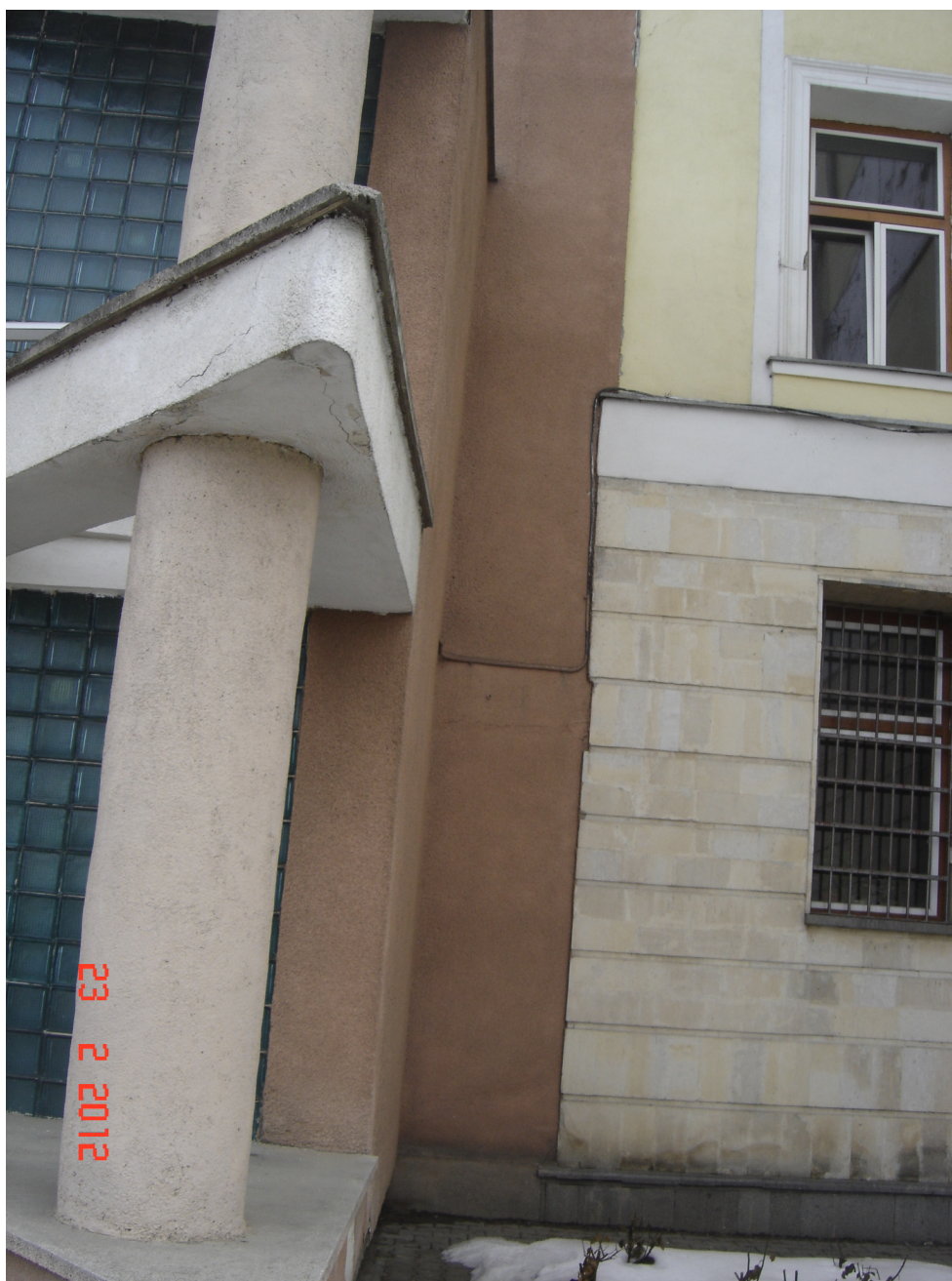
Fig. 11 – Detaliu rost între cladiri