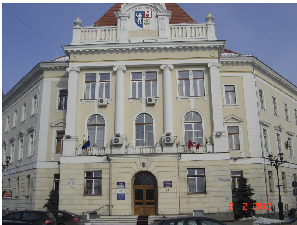
Fig. 7 – Detaliu fatada Principala – Acces Principal