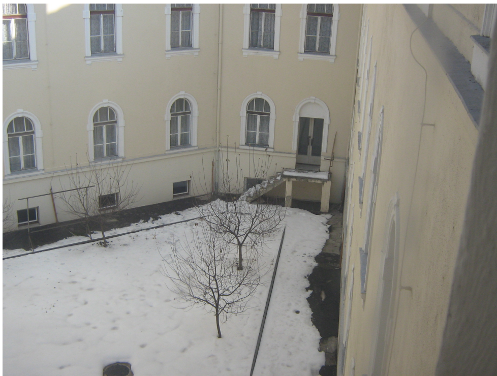
Fig. 17 – Idem