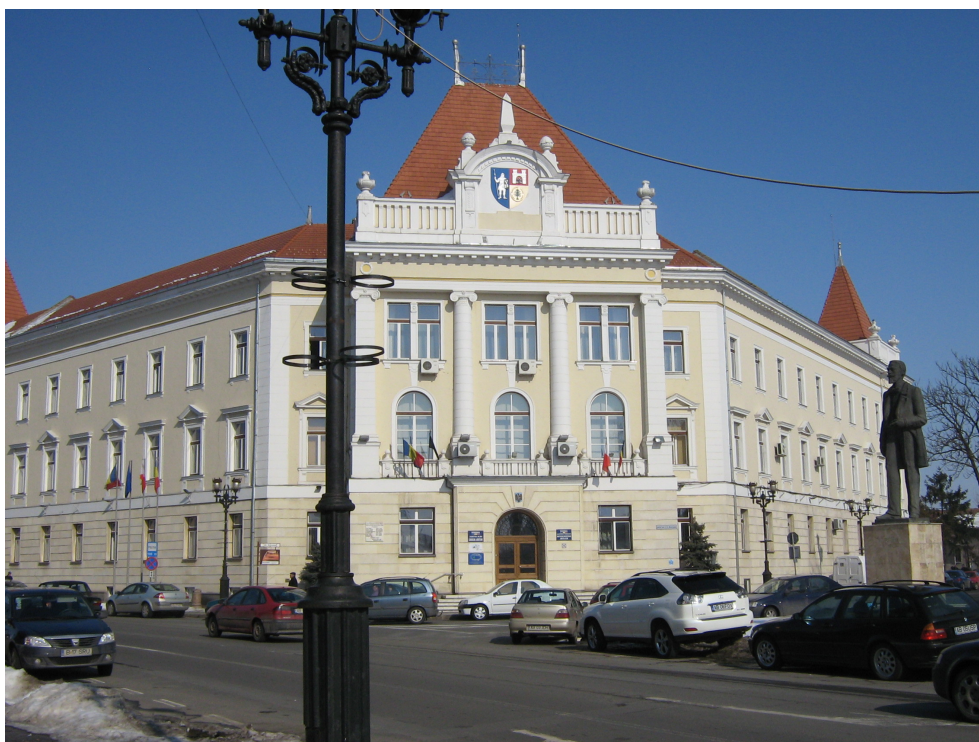
Fig. 2 – Idem