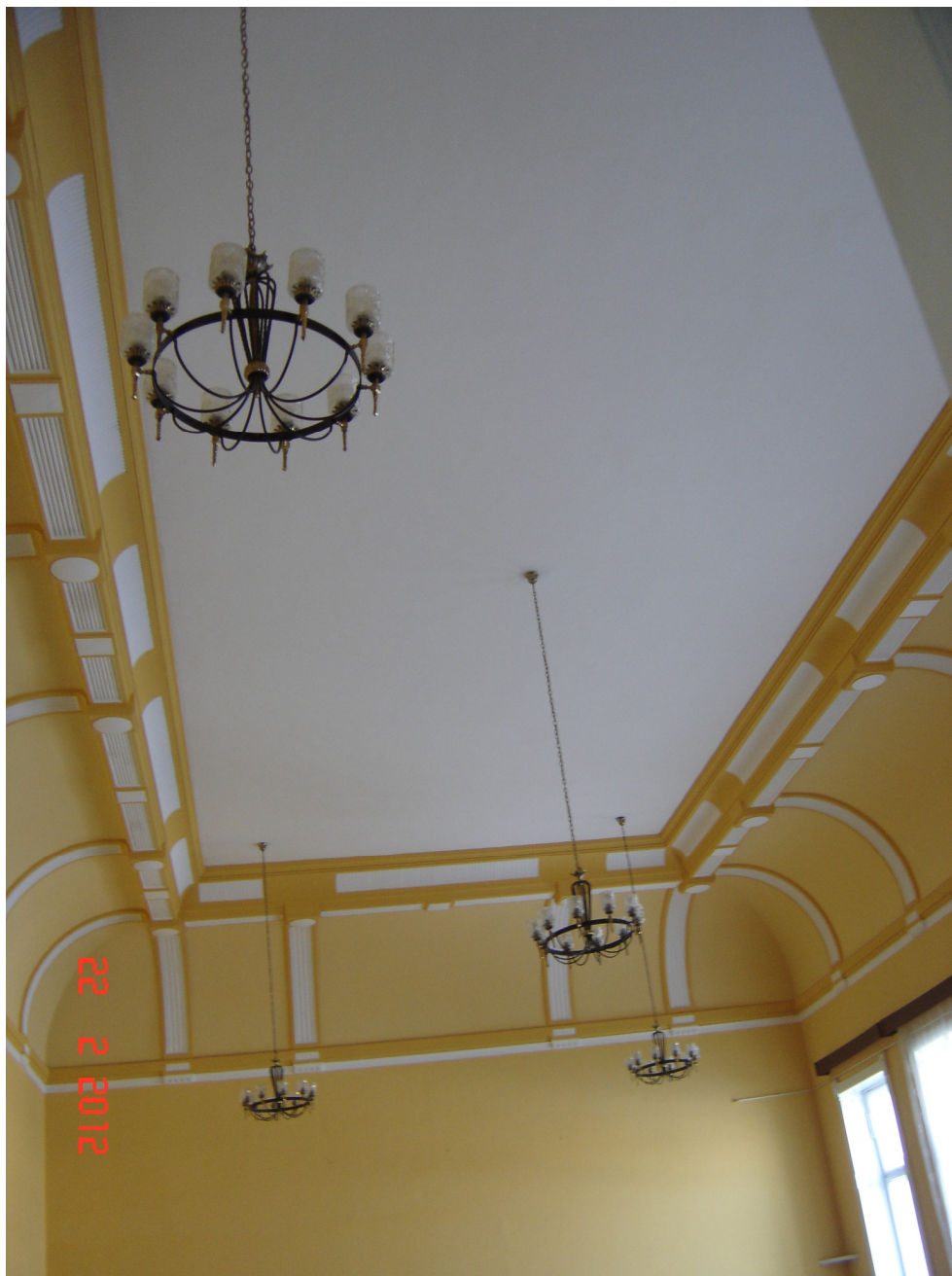
Fig. 27 – Vedere tavan