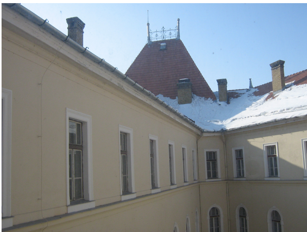
Fig. 15 – Idem