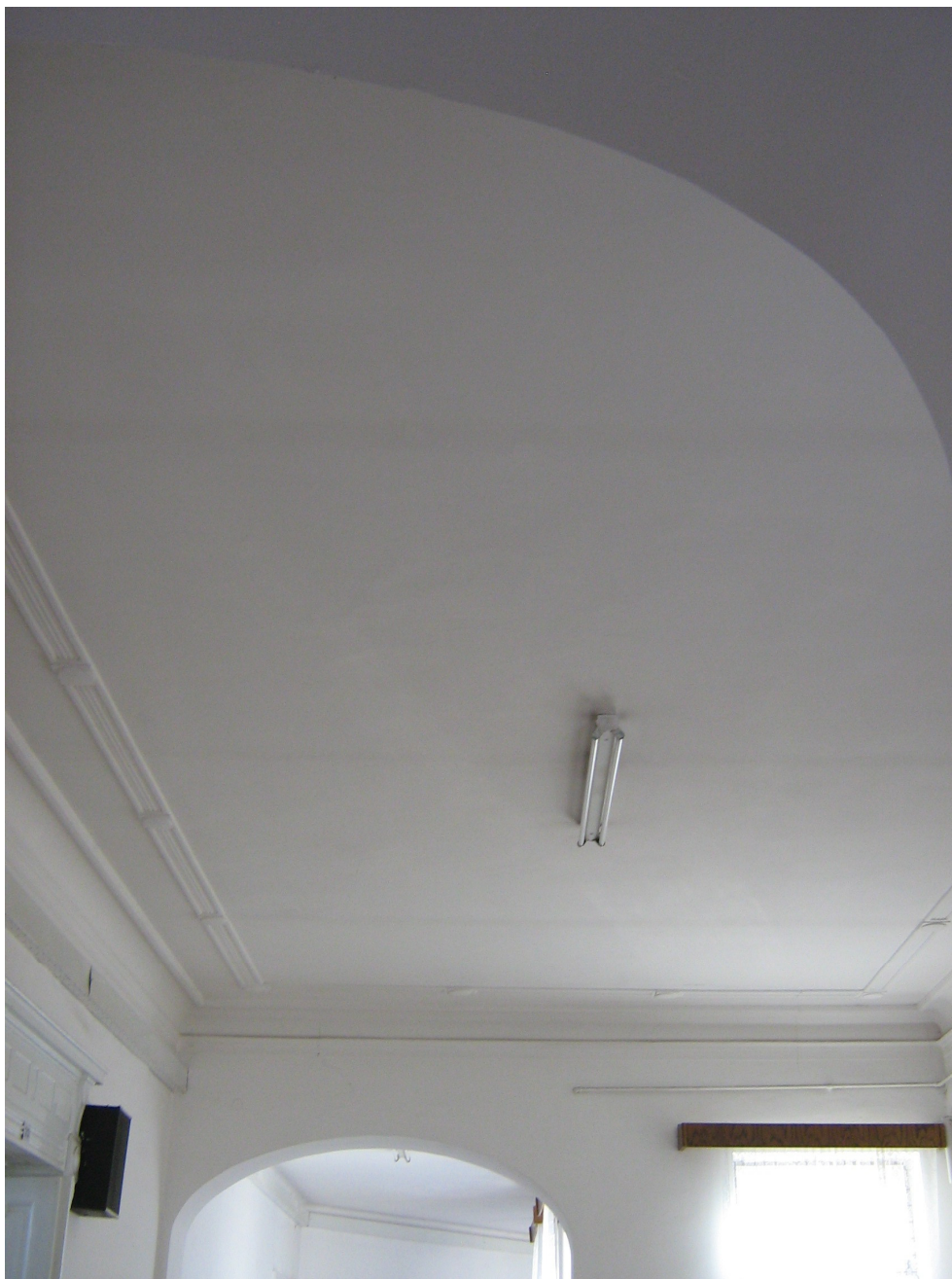
Fig. 30 – Detaliu Tavan