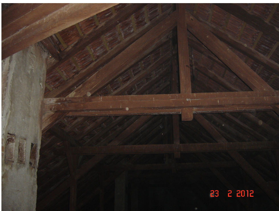
Fig. 41 – Detaliu sarpanta din lemn