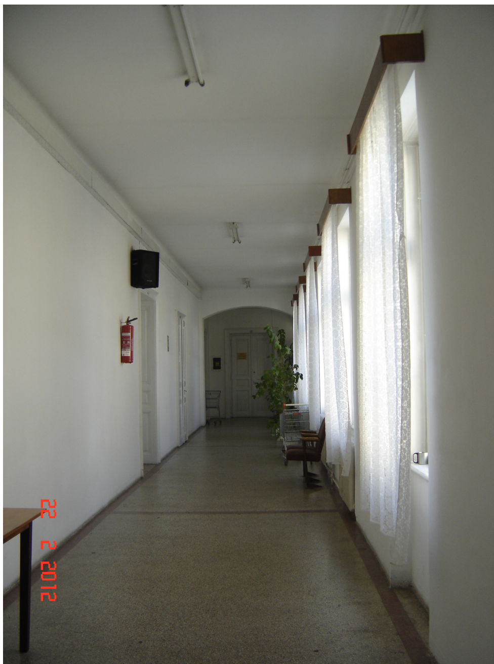
Fig. 20 – Vedere Culoar interior