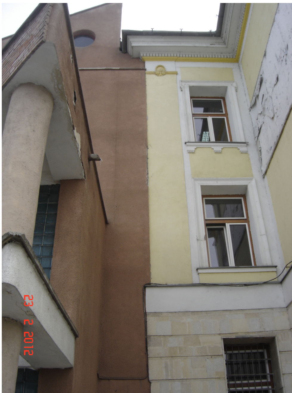
Fig. 12 – Idem