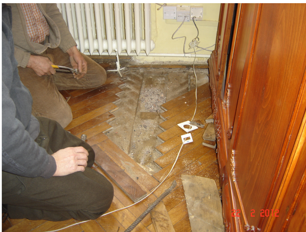
Fig. 33 – Detalii compozitie Pardoseala