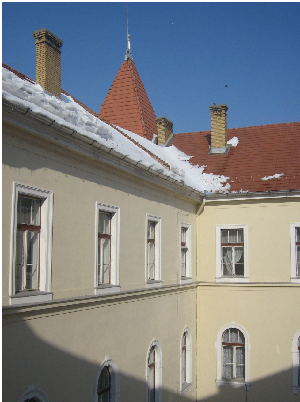
Fig. 13 – Fatada Curte interioara