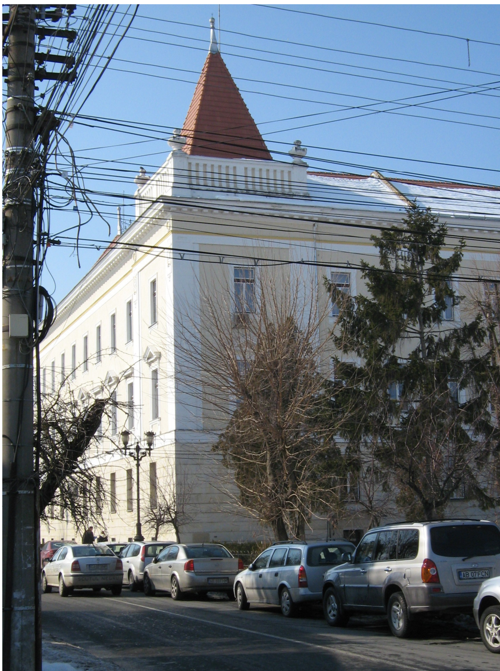
Fig. 10 – Detaliu Fatada Str. Bucuresti