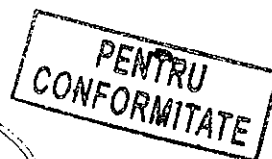
Grefier-șef, Ispas Mihaela